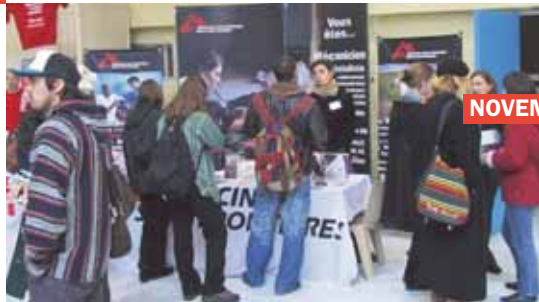
Salon des métiers de l'Humanitaire