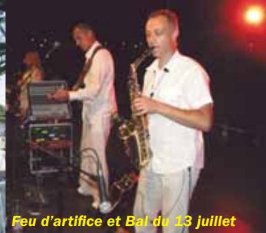
Feu d'artifice et Bal du 13 juillet

Avec des concerts «Musiques du Monde» tous les vendredis soirs au Parc de la Fantasia et «Jazz en Ville» les samedis soirs, 18 concerts gratuits organisés en plein centre ville ont été offerts à tous.