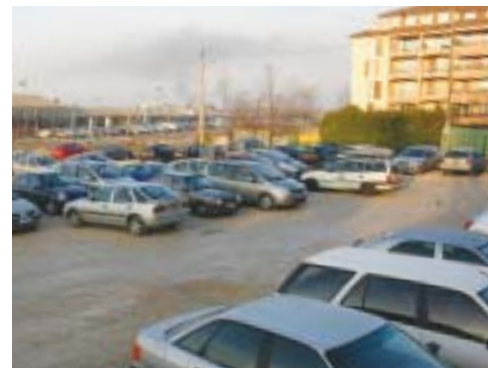
D'ici à 2008, le parking de la rue Naly laissera place à un nouveau groupe scolaire pouvant accueillir plus de 400 enfants.

D'après le calendrier mis en place, le nouveau groupe scolaire du centre-ville devrait ouvrir ses portes aux petits Annemassiens à la rentrée 2008.