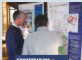
CONCERTATION DES 3 PLACES

Le projet des « 3 Places » s'expose actuellement dans le hall de l'Hôtel de Ville. Cette exposition rend compte des débats issus de la concertation et intègre les éléments produits par les urbanistes compte tenu des contributions