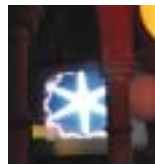
... jusqu'au 9 avril.