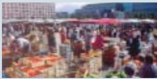
En partie minéralisée, la place de la Libération continuera à accueillir le marché bihebdomadaire.

Vaste espace public de 25 000 m 2 , les 3 Places (place des Marchés, place Clemenceau et place de la Libération) constituent le cœur d'Annessasse. Elles n'en demeurent pas moins, aujourd'hui, un paysage hétéroclite et disgracieux se présentant comme un immense parking à ciel ouvert. Leur embellissement correspond à un engagement politique de longue date. Aussi, la volonté exprimée d'y implanter le siège de la Communauté de Communes de l'Agglomération Annessassienne (2C2A) constitue une réelle opportunité pour entamer l'aménagement de ce qui doit devenir un véritable espace de vie. Afin que chacun puisse enrichir la réflexion autour du projet, un processus de concertation a été mis en œuvre à partir de novembre 2004 . Trois réunions publiques ont permis de recueillir vos suggestions et de