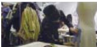
AnnemasseEnPhoto VOIR FLASH BACK PAGE 12