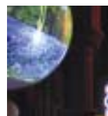
... du Lotorama sont présentées à Château Rouge...

Au lendemain d'un banquet, le rentier Lengluem se réveille la bouche pâteuse, sans aucun souvenir de sa fin de soirée. Il découvre soudain, dans son propre lit, l'un des convives de la veille, un certain Mistingue. Tous deux ont les mains noires et du charbon dans les poches... Denis Plassard utilise la ges-