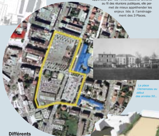
La place Clemenceau au début des années 50...

apportées par les Annessassiens. Enrichie au fil des réunions publiques, elle permet de mieux appréhender les enjeux liés à l'aménagement des 3 Places.