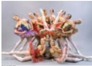
La programmation 2005 du festival Dansez !