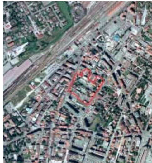
Périmètre situé entre l'avenue de la Gare et la rue du Chablais (à l'intérieur du tracé rouge ci-dessus), le quartier Chablais-Gare reste un morceau de ville inachevé. Son réaménagement, en concertation avec les habitants, contribuera à revitaliser les liens entre la gare et le centre-ville.

La rénovation du quartier Chablais-Gare est en marche. Une concertation est mise en œuvre pendant toute la durée d'élaboration du projet.