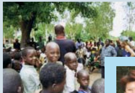
...Pour son action en faveur de l'éducation au Burkina Faso.

ciation annemassienne soutient l'équipe enseignante en favorisant les conditions de vie des élèves : envoi de fournitures et de manuels scolaires, aide au fonctionnement de la cantine et de l'infirmerie, organisation d'échanges de correspondances... En quelques années, le nombre d'élèves est passé de 80 à 220. Cette forte augmentation des effectifs nécessite l'acquisition de nouveaux manuels scolaires et l'augmentation du fonds de la bibliothèque. L'installation d'un point d'éclairage via