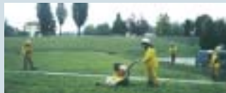
Réinsertion professionnelle avec Trait d'Union

Mais les associations constituent également de véritables acteurs de la vie économique et sociale de la ville.