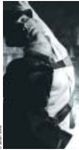
L'esprit ouvert, la curiosité aiguës, vous apprécierez, sans nul doute...