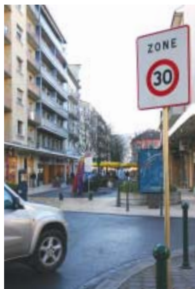
table de l'espace urbain entre tous les modes de déplacement : vigilance et respect de l'autre usager sont de rigueur.

Facilement reconnaissables grâce aux panneaux d'entrée et de sortie spécifiques, les Zones 30 sont souvent dotées d'aménagements de voirie spécifiques (plateaux piétonniers, îlots séparateurs, rétrécissements de chaussées...). Ces espaces impliquent aussi la suppression des bandes cyclables, des panneaux « Cédez le passage », des « Stop » et le rétablissement des priorités à droite. Des conditions de circulation qui imposent donc de rouler au pas et appellent un respect mutuel entre tous les usagers de la route (piétons, cyclistes, motards et automobilistes). La Zone 30 est un partage équi-